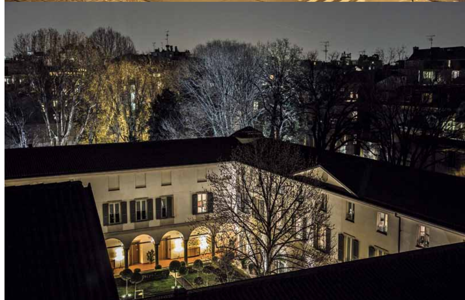
A DESTRA, DALL'HOTEL CHATEAU MONFORT E DAL FOUR SEASONS.